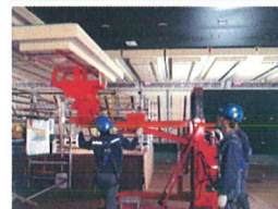
특수단열 판넬 설치