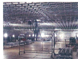
1차방벽 작업 전경

365일 24°C유지 온/습도 관리로 쾌적하고 안전한 최상의 실내 근무 환경임